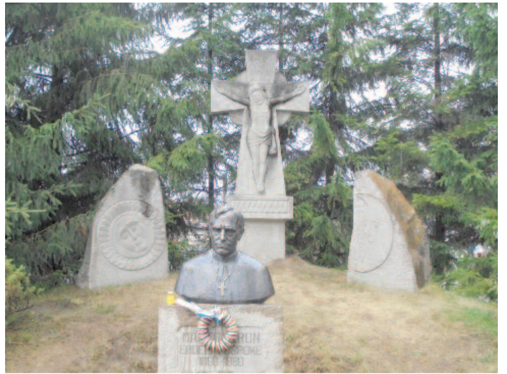
Márton Áron szobra szülőfalujában, Csíkszentdomokoson

Azelőtt három évvel, 1936-ban halt meg a dési születésű Ilosvay Lajos vegyész. Hosszú időn keresztül a Természettudományi Társulat titkára, majd elnöke, 1925-től 1928-ig pedig az MTA másodelnöke. Szerkesztette a Magyar Chemiai Folyóiratot, később a Természettudományi Közlönyt. Korszakalkotó felfedezése: a villámlások hatására nitrogén-oxidok keletkeznek a levegőben, amelyek az esővel mosódnak a földkéregbe. (Világszerte ez a legfonto-