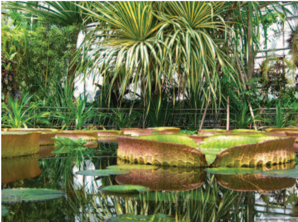
A kolozsvári botanikus kert

„Ha nem őrizzük meg növényvilágunk sokszínűségét, az emberiség nehezen küzd majd meg az élelem, az üzemanyag-biztonság, a környezeti károk és a klímaváltozás okozta globális kihívásokkal” – fogalmazott Samuel Brockington, a Cambridge-i Egyetem botanikus kertjének kurátora, a tanulmány társszerzője. (MTI)