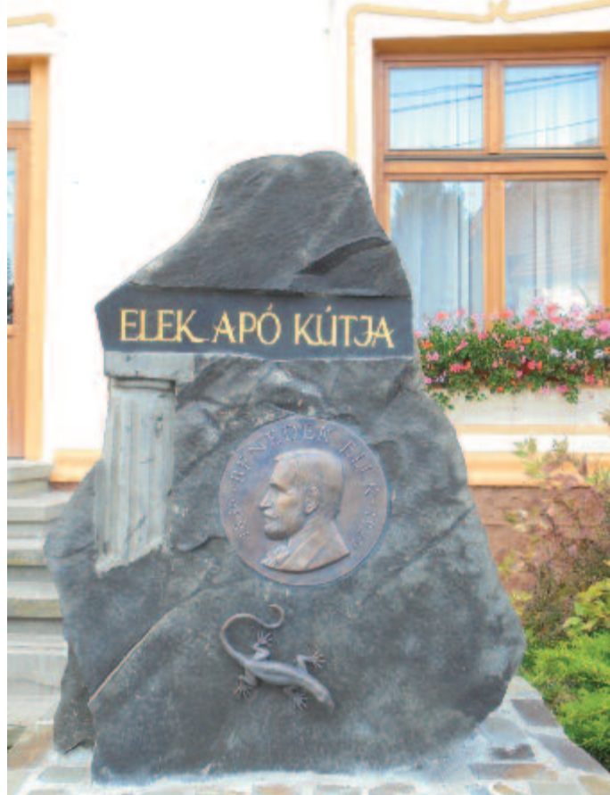
Elek apó kútja Kápolnásfaluban, a Sütő András Kultúrotthon előtt

Kelt 2017-ben, szeptemberben, Szent Mihálykor